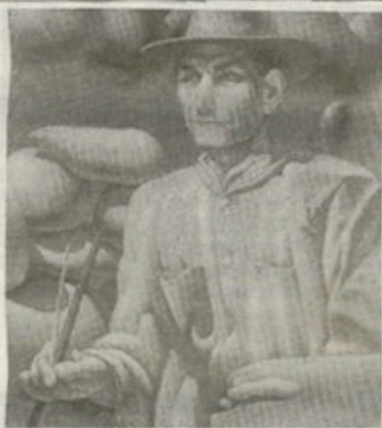
Πέτριος Κόσμος V.

ενότητα που περιλαμβάνεται τον τίτλο "Αδριανός" και ο καλλιτεχνικός κύκλος χαρακτηρίζεται ο διάθεση αμφισβήτησης: "Είτε που θέλει τις μορφές σημειώνεται. Μπορούμε άραγε να παίρνουμε