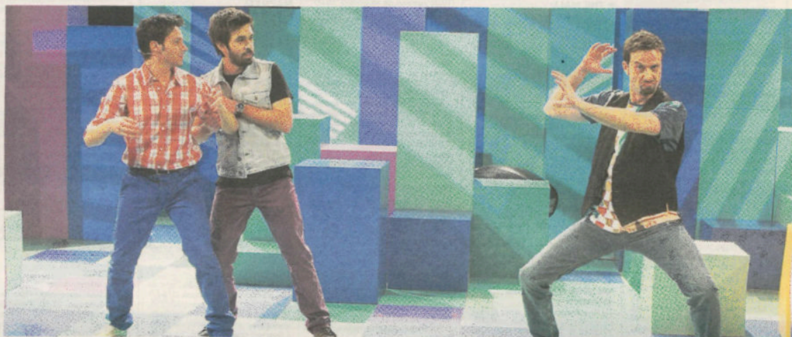
Η παρέα των ηθοποιών στο «Κάψε το σενάριο» (Mega) σε ένα διαρκές κωμικό παιχνίδι σ' αυτό το ιδιαίτερο θεατρικό είδος

Της Πόπης Διαμαντάκου diamanti@doinet.gr